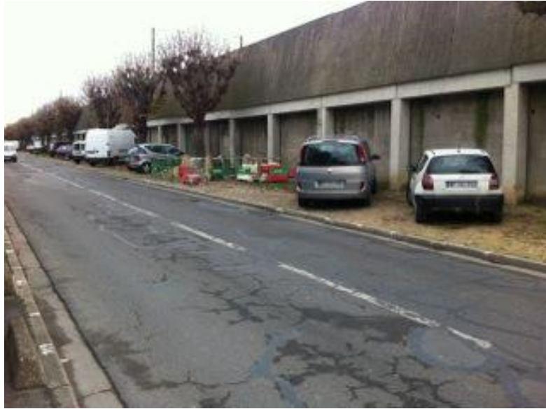
Panneaux de rue vieillissants et perdant leur couleur. Donne une image dégradée de la ville.