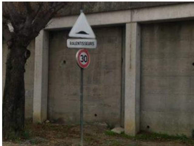
Mobilier urbain ancien.